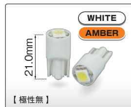
T10 1LED (225201/225202)