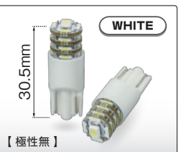
T10 17LED (225232)