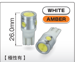
T10 4LED (225223/225224)