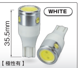
T16 4LED (225251)