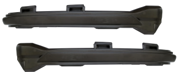
[317209] MAX-シーケンシャル LEDドア ミラー ウィンカー