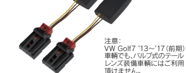
[317202] MAX-セミ シーケンシャル LEDテール ウィンカー ユニット[Type-2](変速機能無し)

注意: VW Golf7 '13~'17(前期)車輻でも、バルブ式のテール レンズ装備車輻にはご利用頂けません。